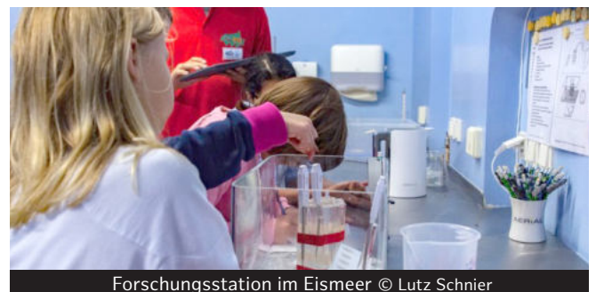
Forschungsstation im Eismeer

Für die verbleibenden zwei Tage ist es möglich, die Schülerinnen und Schüler in Kleingruppen zu jeweils einer Tierart intensiv als Forscher arbeiten zu lassen. Durch spezielle Beobachtungsaufträge können sie zu Experten ihrer Tierart und deren Lebensweise werden. Nach den zwei Tagen Forschung im Tierpark oder Tropen-Aquarium können die Ergebnisse in der Schule präsentiert werden. Hierfür können zum Beispiel Plakate erstellt, Vorträge gehalten oder Geschichten geschrieben werden.