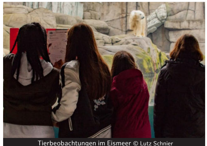
Tierbeobachtungen im Eismeer

Im musischen Bereich können Sie thematisieren, wozu die Musik vieler Tiere dient. Teilnehmende aus den höheren Jahrgängen nehmen Geräusche auf und mixen in der Schule ihren eigenen Beat. In der Kunst sind einem keine Grenzen gesetzt. Begeben Sie sich mit Ihrem Kurs auf die Suche nach Motiven, arbeiten Sie sich durch verschiedene Techniken und setzen Sie über Farbe, Ton und Kameras unterschiedlichste Materialien ein. Mit Ihren älteren Schülerinnen und Schülern thematisieren wir auch gerne die architektonischen Besonderheiten des Tierparks.