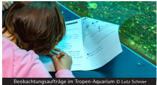
Beobachtungsaufträge im Tropen-Aquarium

individuelle Schwerpunkte zu setzen und Themen eigenständig zu bearbeiten. Unterstützen Sie Ihre Schülerinnen und Schüler dabei mit unseren Beobachtungsaufträgen aus den Themenheften . Am letzten Tag der Projektwoche können die Forscherinnen und Forscher ihre Ergebnisse auch vor Ort präsentieren.