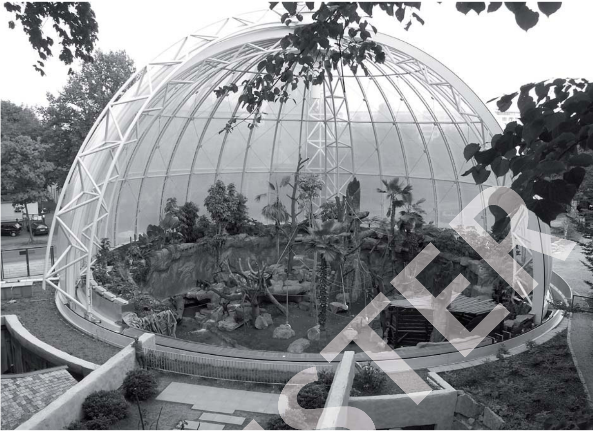
Blick durch das geöffnete Kuppeldach in das neue Orang-Utan-Haus.