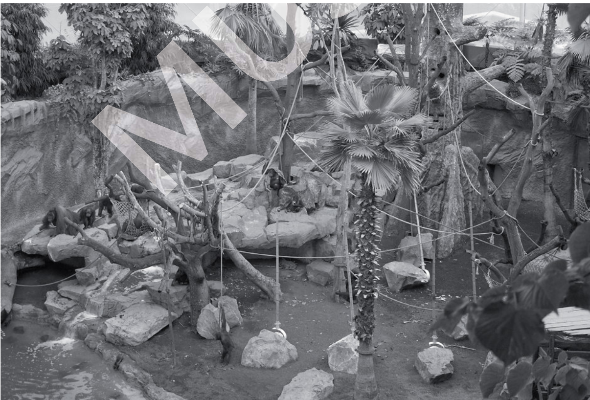
Die naturnahe, tiergerechte Einrichtung des Geheges bietet den Orang-Utans viel Abwechslung.